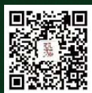
亲和源微信号 Q INHEYUAN2